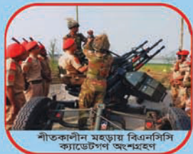
শীতকালীন মহড়ায় বিএনসিসি ক্যাডেটপন অংশগ্রহণ