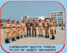
রেজিমেন্ট ক্যাম্প পর্যায়ে স.দে.ক প্রাটন অংশগ্রহণ