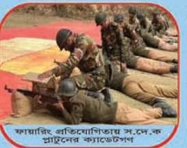
ফায়ারিং প্রতিযোগিতায় স.দে.ক প্রাটনের ক্যাডেটপন