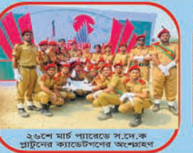
২৬শে মার্চ প্যারেডে স.দে.ক প্রাটনের ক্যাডেটপনের অংশগ্রহণ