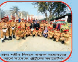
জাযা শহীদ দিবসে অধ্যক্ষ মহোদয়ের সাথে স.দে.ক প্রাটনের ক্যাডেটপন